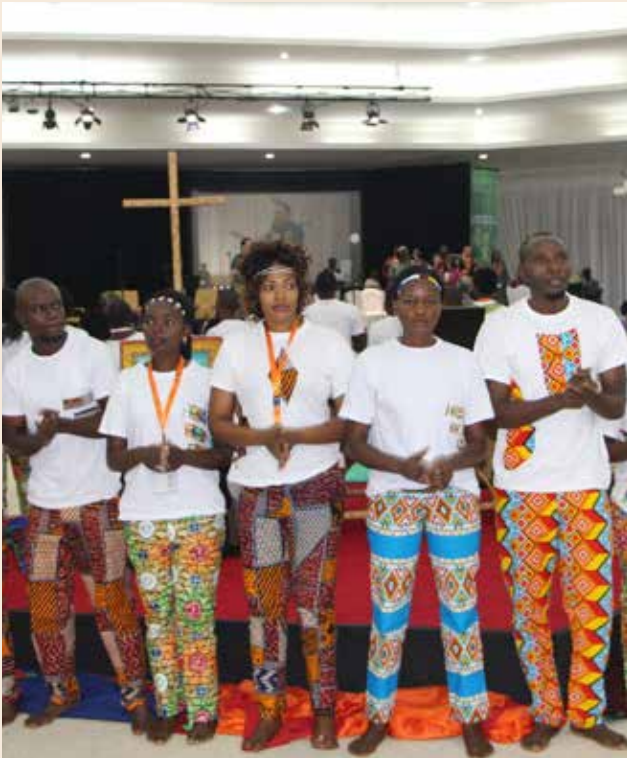
13. Weltmissionskonferenz in Arusha/Tansania 2018

Staates, welche einst Brecht und heute Naomi Klein als Vorzeichen des Faschismus bezeichneten?