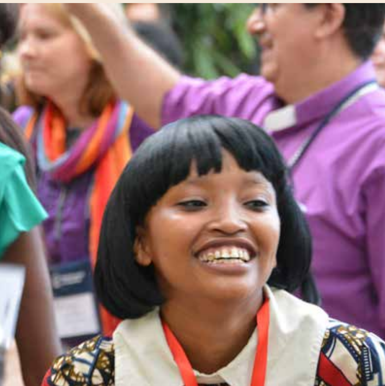
13. Weltmissionskonferenz Arusha/Tansania 2018

Ich engagiere mich im Jerusalemsverein . Er ist im Grund ein Förderverein für christliches Leben und genauer evangelisches Leben im Heiligen Land. Im Zentrum steht die Förderung von Schularbeit. An der evangelischen Schule Talitha Kumi bei Bet Jala oberhalb von Bethlehem treffen muslimische Schüler und Schülerinnen auf christliche aus allen Konfessionen. Was dort lokal an Umgang erlebt wird, kann auch in die Gesellschaft wirken. Was Schulleitung und Lehrerschaft dort leisten, kann in seiner Bedeutung für diese Region nicht überschätzt werden. Ansonsten bin ich Mitglied im Förderverein für das ökumenische Studienjahr in Jerusalem, weil viele Studierende Erfahrungen in dieser einzigartigen und zuweilen verrückten Stadt machen können sollten. Seine Bedeutung kann man übrigens auch daran sehen, dass der Deutsche Akademische Austauschdienst (DAAD) dieses Programm namhaft fördert. Ökumene zwischen Konfessionen und Religionen wirkt über die Kirchen hinaus!