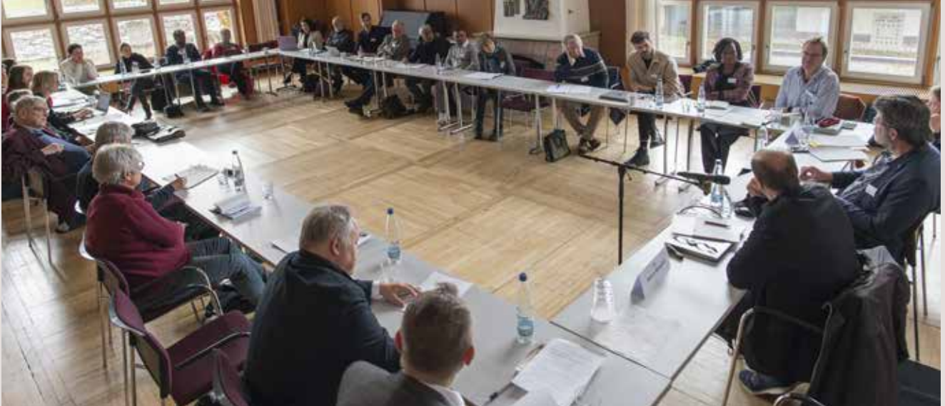
Ökumene-Forum „Kirchen und Konflikte“ an der Evangelischen Akademie Bad Boll 18.11.2023