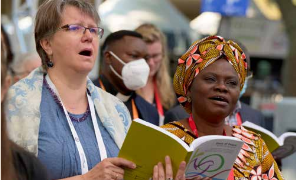
Morgengottesdienst auf der 11. ÖRK-Vollver- sammlung in Karlsruhe

gegründet hat. Meine Bewunderung und Dankbarkeit gelten auch allen, die diese Bewegung initiiert und ins Leben gerufen haben. Mich inspirieren auch die Menschen, die um mich herum sind und mich auf meinem persönlichen ökumenischen Weg begleiten, wie etwa die früheren und jetzigen Vorstandsmitglieder und Mitbegleiter:innen des Vereins Pro Ökumene. Dank ihnen fand ich den Weg in dieses Gremium, in dem wir die Bildungsarbeit rund um ökumenische Themen nach vorne bringen können und neue Erlebnisse und Erkenntnisse über „die Anderen“ vermitteln können in der Hoffnung, dass diese Erfahrungen uns alle näher zusammenbringen.