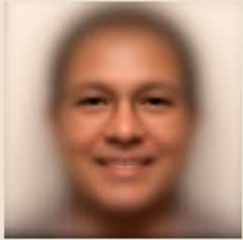
Photo Art Project with the Participants of the 11th Assembly of the WCC by Artist Wolf Nkole Heizle