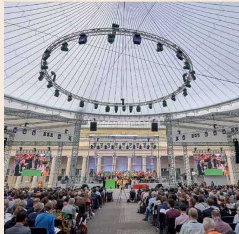
Gottesdienst im Zelt - das wandernde Gottesvolk feiert auf der 11. ÖRK-Vollversammlung

Solidarität bedeutet für mich deshalb nicht nur Mitleid, sondern ein aufmerksames Mitgehen: hinsehen, nicht weghören, Strukturen hinterfragen und Räume für Veränderung öffnen. Die Ökumene lehrt mich, dass wir als Christ:innen nicht nur gemeinsam glauben, sondern auch gemeinsam Verantwortung tragen – füreinander und für eine gerechtere, diskriminierungsfreie Kirche und Gesellschaft.