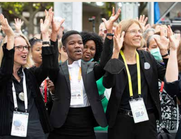
Gottesdienst auf der 11. ÖRK-Vollversammlung in Karlsruhe 2022

Die Schwedische Kirche hat in meinem Leben eine entscheidende Rolle gespielt, indem sie mich vom ersten Kontakt 1989 als ausländische Praktikantin in Gemeinden in Uppland und Hälsingland förderte,