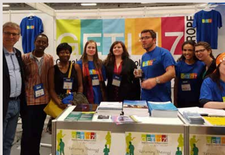
Das Global Ecumenical Theological Institute des ÖRK auf dem Deutschen Ev. Kirchentag