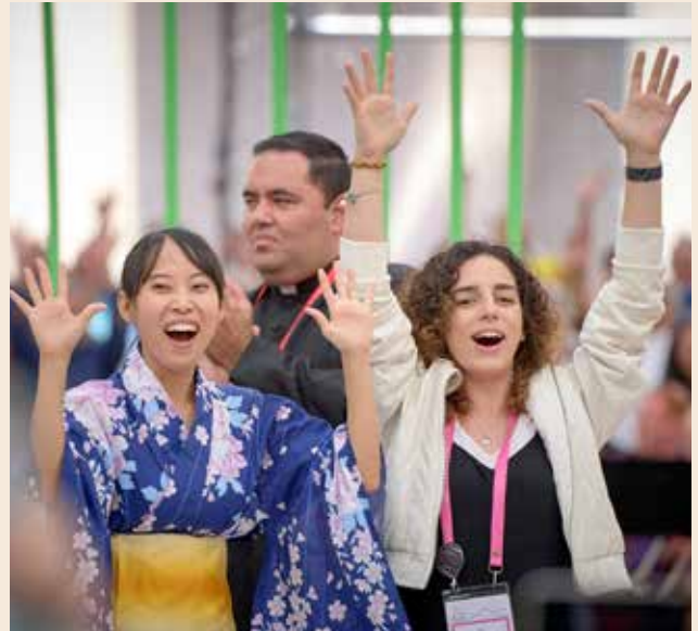
11. ÖRK-Vollversammlung Karlsruhe

Nach fast zehn Jahren am Ökumenischen Institut Bossey sind mir die Begegnungen mit den internationalen und ökumenischen Studierenden sehr ans Herz gewachsen. Das gegenseitige Zuhören und voneinander Lernen sind extrem bereichernd und inspirierend. Diese studentischen Geschwister, die ich in der gesamten Welt auf Reisen antreffen darf, sind für mich wie eine weltweite Familie geworden.