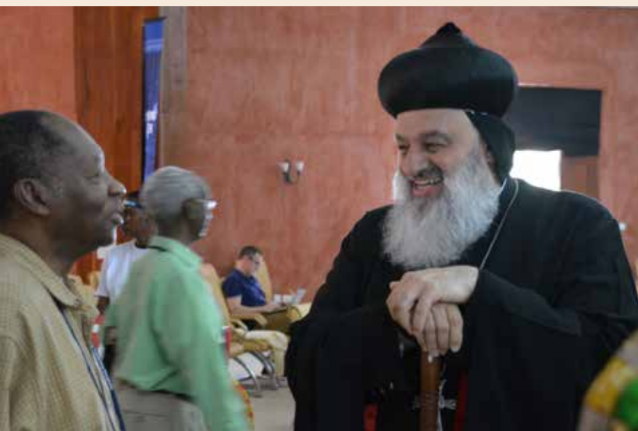
13. Weltmissionskonferenz Arusha/Tansania 2018

Ich träume von einer Kirche, die ihren Kontrast zur Welt nicht dadurch markiert, dass sie andere ausschließt, sondern dadurch, dass sie sich als inklusivste Gemeinschaft von allen erweist. Ein Ort, in dem die Liebe Jesu nicht nur gepredigt, sondern auch gelebt und erlebt wird. Eine Kirche, die durch ihre Nächstenliebe überzeugt. Eine Kirche, die von Hoffnung und nicht von Angst oder Geldnot bewegt ist. Eine Kirche, die im Frieden nicht nur das Ziel, sondern, dem Bergprediger Jesus von Nazareth folgend, auch den einzigen Weg erkennt.