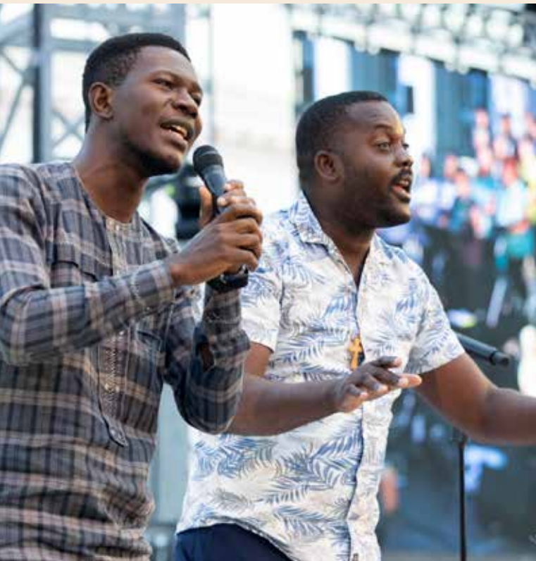
Musikteam 11. ÖRK-Vollversammlung Karlsruhe 2022

Während meiner Zeit als Mitarbeiterin in der Kommission für Glauben und Kirchenverfassung war ich zuständig für die Studiengruppe, die sich mit den tiefen Spannungen rund um ethische Fragen beschäftigt hat. Wir haben es geschafft, einen gemeinsamen Text mit dem Titel „Dialog fördern, um Koinonia [Gemeinschaft] zu stärken“. Das war sehr anstrengend und aufreibend. Es geht eben nicht nur um Themen, sondern um Menschen, und das heißt, es geht um Leib und Leben. Durch den Text werden die verschiedenen Perspektiven und Positionen nicht aufgelöst, es gab auch keinen differenzierten Konsens, sondern weiterhin Dissens. Diese Realität anzuerkennen und darüber in wahrhaftiger Weise zu sprechen und weiterhin aufmerksam zuzuhören, ist eine wichtige ökumenische Aufgabe. Wie wichtig das, was wir in der Kommission erarbeitet haben, ist, habe ich jeden Tag am Ökumenischen Institut in Bossey erlebt. Der Schmerz der Differenz und der Spaltung war an manchen Tagen mit Händen zu greifen. Wichtig war dabei, immer wieder neu den Kontakt, das Gespräch und die Gemeinschaft zu suchen – und voller Dankbarkeit und Freude entgegenzunehmen, wenn Verständnis und Verständigung und echte Koinonia spürbar wurden.