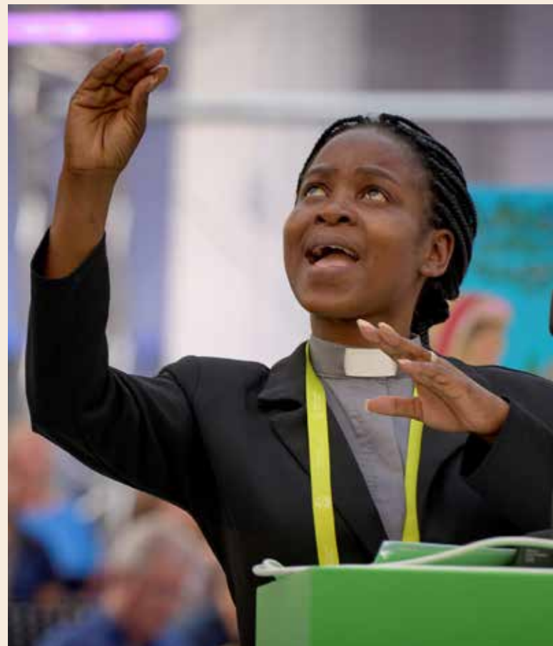
Schriftlesung einer Vertreterin von EDAN auf der 11. ÖRK-Vollversammlung

Dies hat mich dazu bewogen, einem meiner Bischofsberichte die Überschrift zu geben: „Unerschrocken, fröhlich, selbstbewusst ... vom Zeugnis der Christen.“