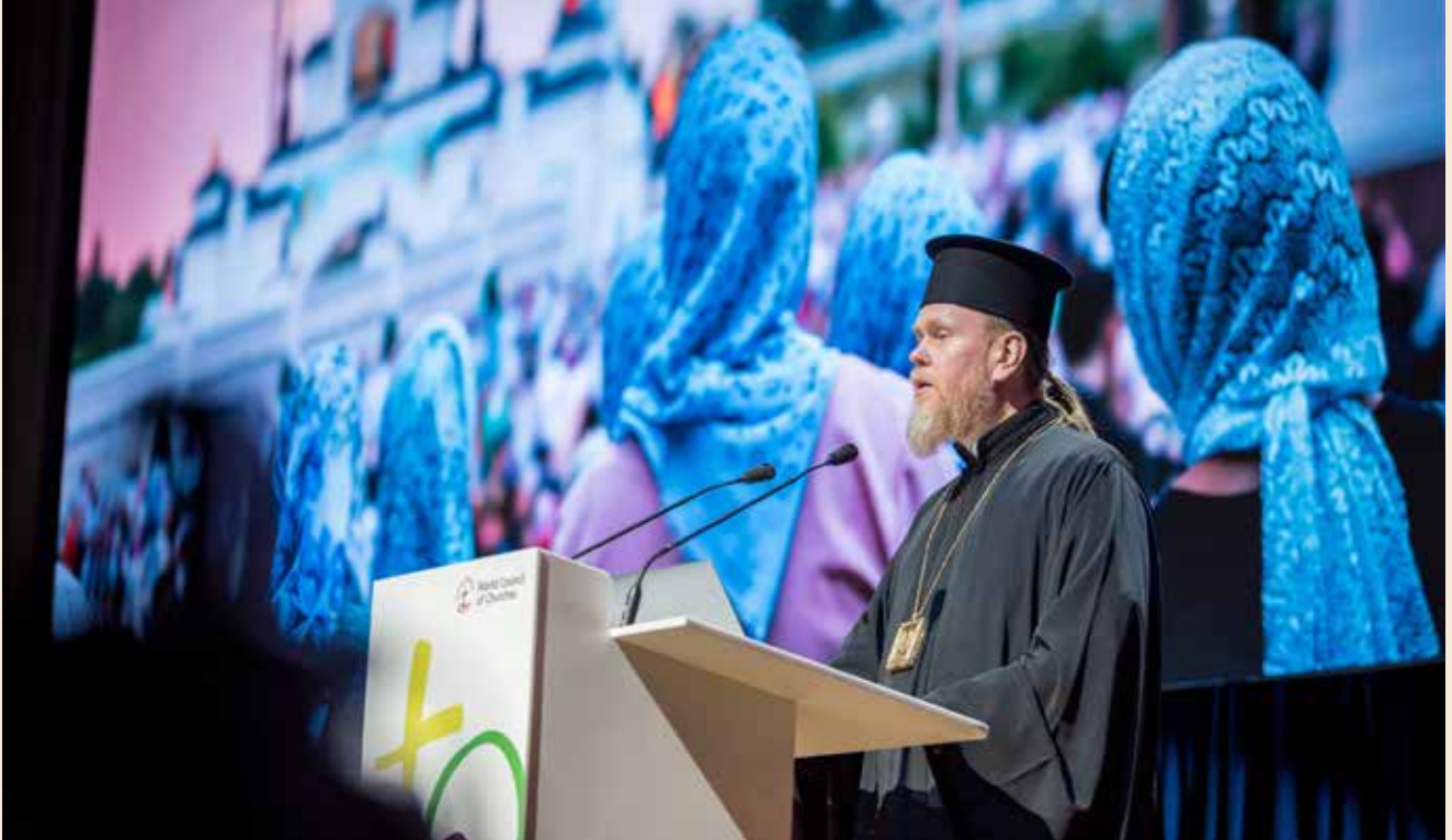
H.E. Archbishop Yevstraty of Chernihiv and Nizhyn (Orthodox Church of Ukraine), 11. ÖRK-Vollversammlung

die Durchführung des jährlichen Weltgebetstages ist ein großartiges ökumenisches Zeichen.