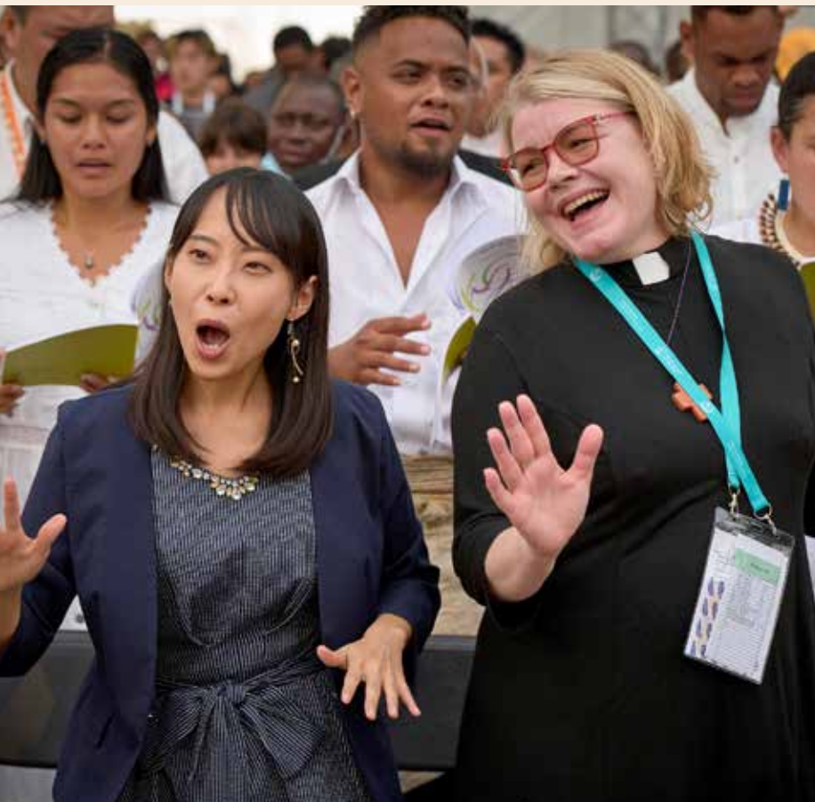
Gemeinsames Singen auf der 11. ÖRK-Vollversammlung

Ich habe einige Erinnerungen aufgeschrieben, die in die Gründung von Pro Ökumene eingeflossen sind. Was bleibt? Dankbarkeit denen gegenüber, die über die vielen Jahre den Informationsdienst von Pro Ökumene herausgegeben haben. Den Redakteuren und Autoren mit ihren Berichten und Predigten und Recherchen, die uns Alten, ich bin jetzt 85 Jahre alt, unbekannte Fragen stellten und ungefragte Antworten vermieden.