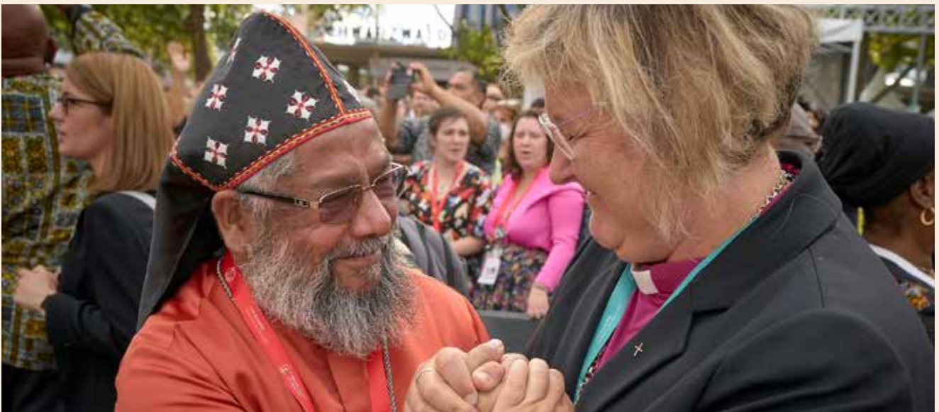
Verabschiedung von Teilnehmenden der 11. ÖRK-Vollversammlung in Karlsruhe

Eindrücke und Lernerfahrungen didaktisch aufzubereiten und zurück nach Württemberg zu bringen. Das Thema Frieden wurde dort in seinen verschiedenen Aspekten behandelt. Die beiden Fragen, die mich seither beschäftigten, sind zum einen wie „Frieden zwischen und in den Kirchen“ eine eigene Schwerpunktsetzung in unserer ökumenischen Zusammenarbeit bekommen kann. Zum anderen, was wir als christliche Kirchen zur Förderung des gesellschaftlichen Friedens und dem Frieden zwischen den Völkern beitragen können. Das gesamte Thema hört sich sehr abstrakt und übergroß an, aber fängt für mich im Kleinen vor Ort in der Gemeindegarbeit und im Zusammenleben im Wohnquartier an. Aus diesem Grund engagiere ich mich etwa für den Auf- und Ausbau von Do it together (DIT), einem Netzwerk, das junge Erwachsene unterschiedlicher Konfessionen in und um Reutlingen miteinander in Kontakt bringt. Bei dieser Arbeit ist mir die Suche nach einer den Frieden fordernden und fördernden Kommunikations-, Gesprächs-, Erzähl-, ja Streitkultur wichtig geworden. Zu lernen, immer neu aufeinander zu hören, ist für mich der Kern ökumenischen Miteinanders, der zur Bewahrung des Friedens unumgänglich ist. Dazu sind verlässliche und etablierte Lernorte wertvoll und bewahrenswert. So, wie sie Pro Ökumene im vielfältigen Engagement, aber vor allem in den regelmäßig veranstalteten Foren eröffnet.