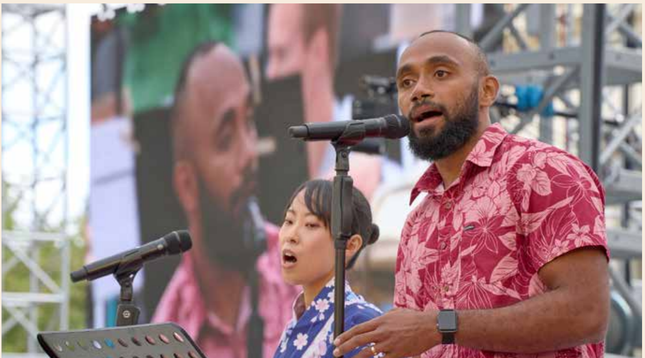
Musikteam 11. ÖRK-Vollversammlung Karlsruhe

The brothers and sisters of the ecumenical networks of queer Christians in Asia whom I work with closely are important to my life and provide me with important support to continue my work. Rainbow Pilgrims of Faith has become my family for over ten years, our close connection is an important source of strength and inspiration to me.