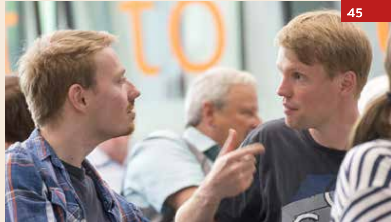
Vorbereitungstagung zur 11.ÖRK-Vollversammlung in der Evangelischen Akademie Bad Boll

Ökumenische Bezüge sind unverzichtbar. Sie erinnern daran, dass wir Teil der einen verstreuten Diaspora sind. Besonders nahe stehe ich dem Gustav-Adolf-Werk